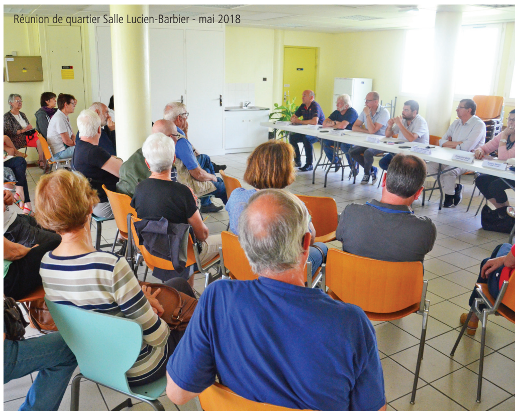
Réunion de quartier Salle Lucien-Barbier - mai 2018

Les Saranais peuvent ainsi interpeller leurs édiles de proximité sur des sujets qui dé-