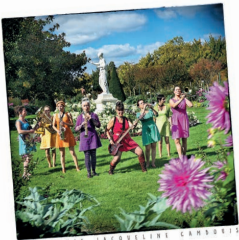
COMPAGNIE JACQUELINE CAMBOUIS

Les festivités du 13 juillet allient tradition, avec la distribution des lampions et la retraite aux flambeaux. Et originalité avec le spectacle théâtral, musical et burlesque de la compagnie Jacqueline Cambouis. Suivi d'un spectacle pyrotechnique à ne pas manquer.