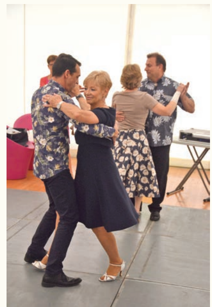
Photographies de l'édition 2017