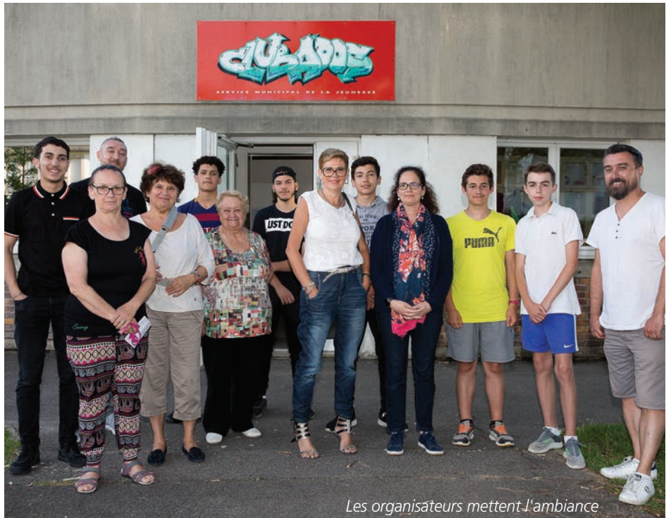
Les organisateurs mettent l'ambiance

En ce samedi, la fête débutera donc dès l'aurore, soit vers 6h, par le traditionnel vide-greniers proposé tout au long de la journée par l' Union des commerçants , sur le parking de l'avenue des Champs-Gareaux. Une signalétique créée pour l'occasion conviera ainsi le public à la